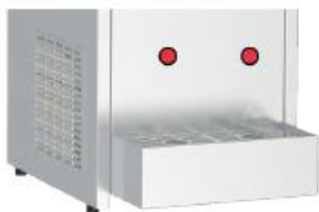
Emplacement des cellules infrarouge

+ 2 sorties - distribution déclenchée par les cellules infrarouges dès qu'elles détectent la présence d'un récipient