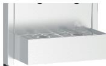
Grille inox pour poser les carafes